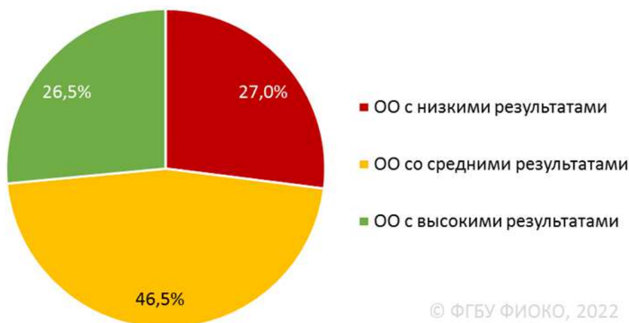
Рисунок 1. Распределение ОО по результатам (общероссийская выборка, 2021 г.)

При этом надо помнить, что образовательные результаты — это только один из показателей эффективности школы. Успешна ли школа в вопросах воспитания, профориентации? Зная ответы на эти вопросы, можно предположить, как работа школы сказывается на благополучии будущих выпускников.